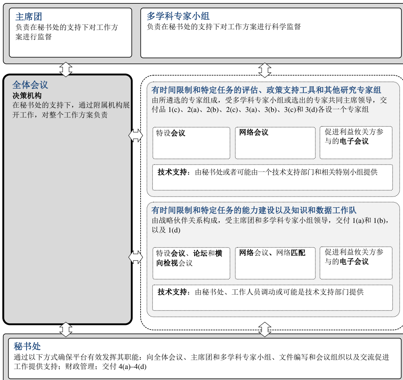
图 2 交付工作方案所需体制安排示意图

纳入区域中心及区域或专题英才中心的一种手段。秘书处将通过一份由主席团批准的、有时间限制和特定任务的伙伴关系协定监督所有技术支持提供者和技术支持部门。在接受任何实物捐助时，全体会议不妨遵循下文第 19 段所载程序。